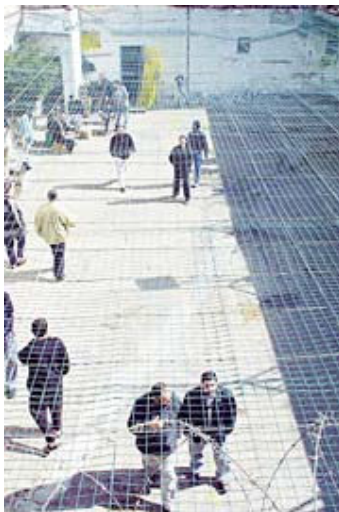
סמכויות שנתרו בידי המדינה

היקף החוזה נאמד ב-1.4 מיליארד שקל; הקבוצה הזוכה גם תפעיל ותנהל את הכלא במשך 22 שנה